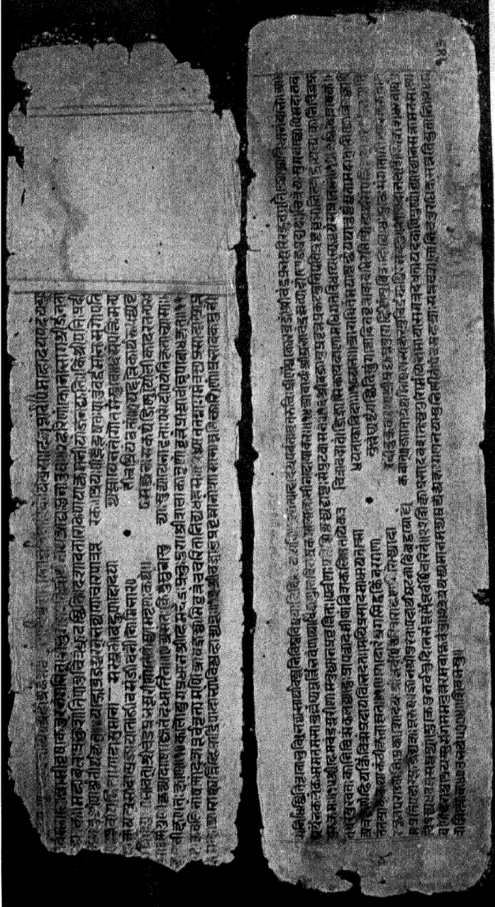
प्रभावकचरितकी A संज्ञक प्रतिके आदि और अन्तके पत्रकी प्रतिकृति ।